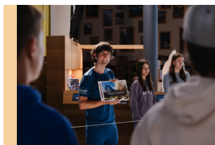
QuizParcours Welterbe SAJA Zyklus 2 + 3 (5H-11H)