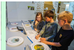
LernParcours Aletschfloh: Klimawandel verstehen Zyklus 1 + 2 (1H-4H)

Folgend findest du einen Überblick der verschiedenen Schulangebote im WNF, die durch einen WelterbeGuide geführt und begleitet werden: