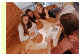
PostenParcours Welterbe SAJA Zyklus 2 + 3 (5H-11H) / Sek II

Damit der Lernausflug nachhaltig in Erinnerung bleibt, empfehlen wir eine Vor- und Nachbearbeitung . Ein entsprechendes Lernarrangement (ab Zyklus 2) mit einem kurzen Lernfilm findest du hier.