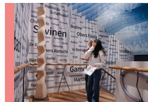
PostenParcours Klimawandel Sek II